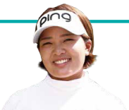
Ai Suzuki 鈴木 愛 選手

2017年国内女子ツアーがスタート! PING契約プロは、このオフシーズンにPINGカスタムフィッティングでベストなセッティングを武器に、今年の開幕戦に臨みます。各選手のクラブセッティングにもご注目ください。