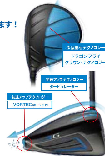
深低重心テクノロジー ドラゴンフライ クラウンテクノロジー