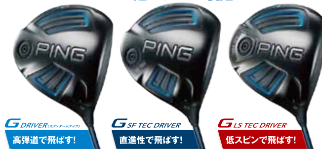
G DRIVER (スタンダードタイプ) 高弾道で飛ばす！