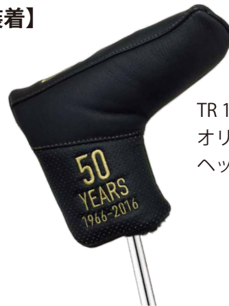
TR 1966 オリジナル ヘッドカバー